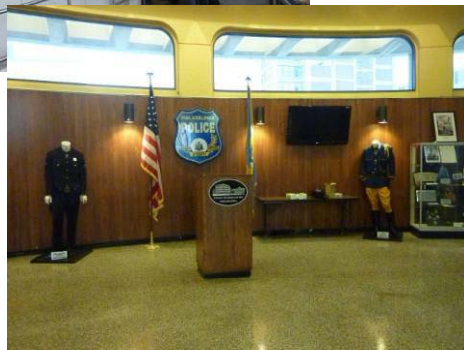
(中、下)フィラデルフィア市警