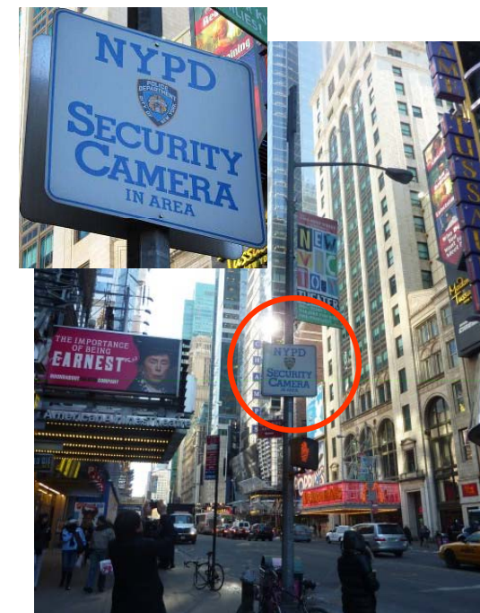
タイムズ・スクエア地区の設置表示