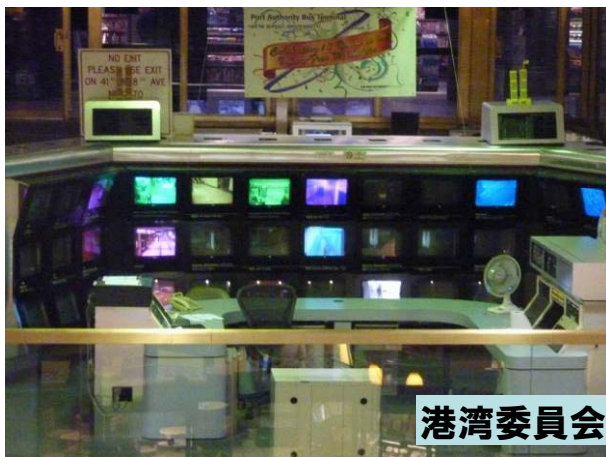
港湾委員会バスターミナル