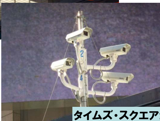
タイムズ・スクエア地区の防犯カメラ