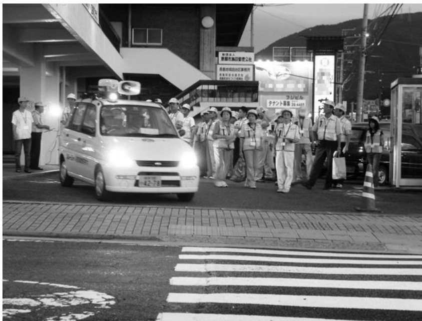
夏休み前一斉パトロール出発式