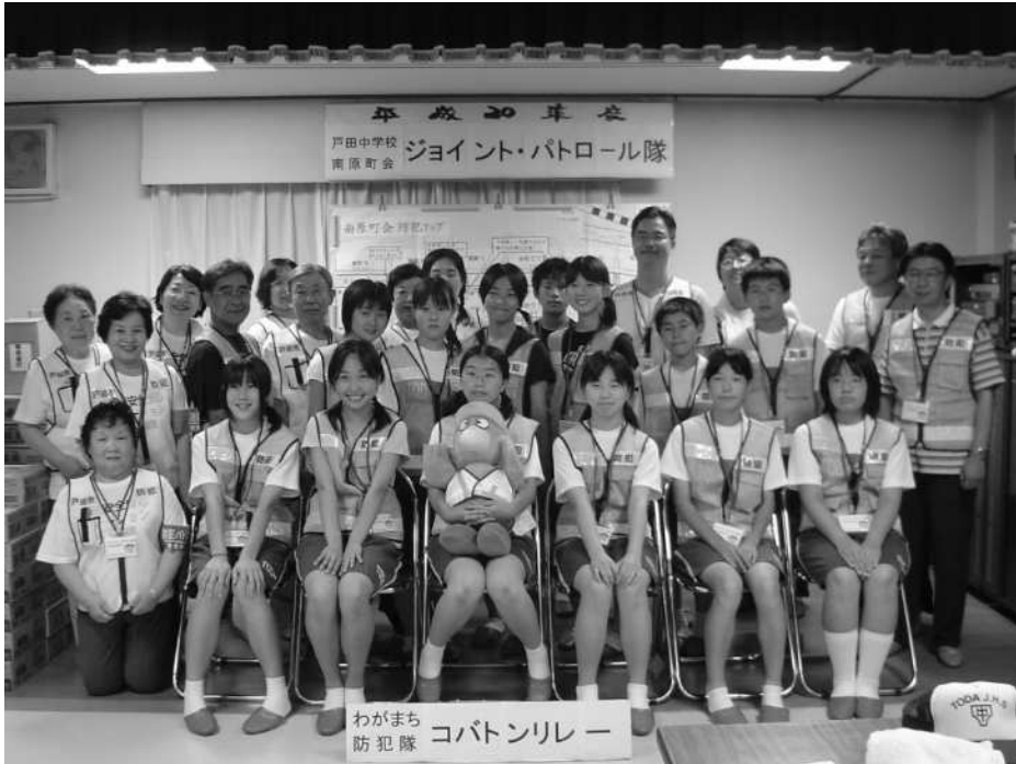
戸田中学校・南原町会合同防犯パトロール