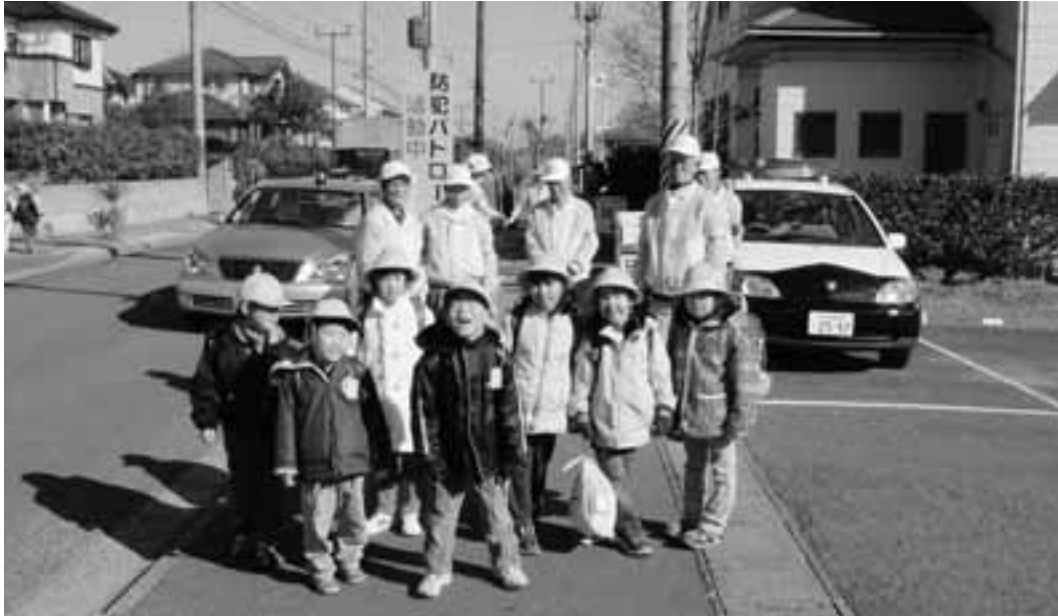
小学生下校時間帯における防犯パトロール