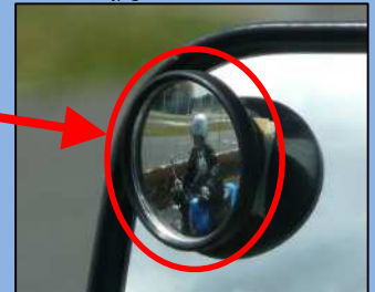
補助ミラーでは死角にいる自動二輪車を確認できる。