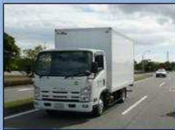
真後ろから緊急車両が接近中