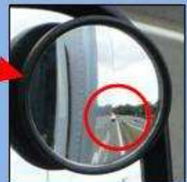
補助ミラーでは真後ろの緊急車両を確認できる。