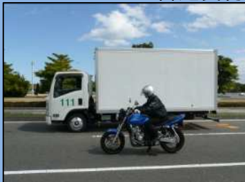
サイドミラーの死角にいる自動二輪車