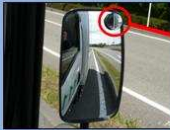
サイドミラーでは緊急車両を確認できない。