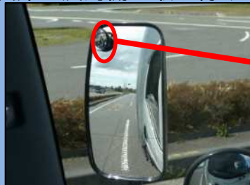
サイドミラーでは自動二輪車を確認できない。