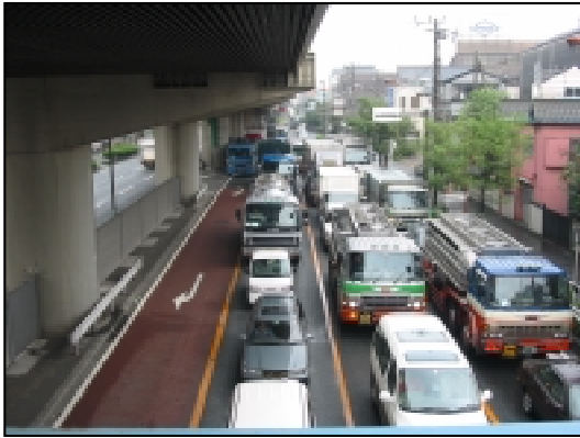
塩浜交差点（下り）の交通状況