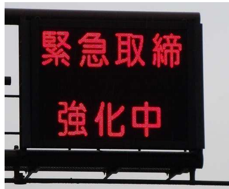
情報発信の現状と今後の展開