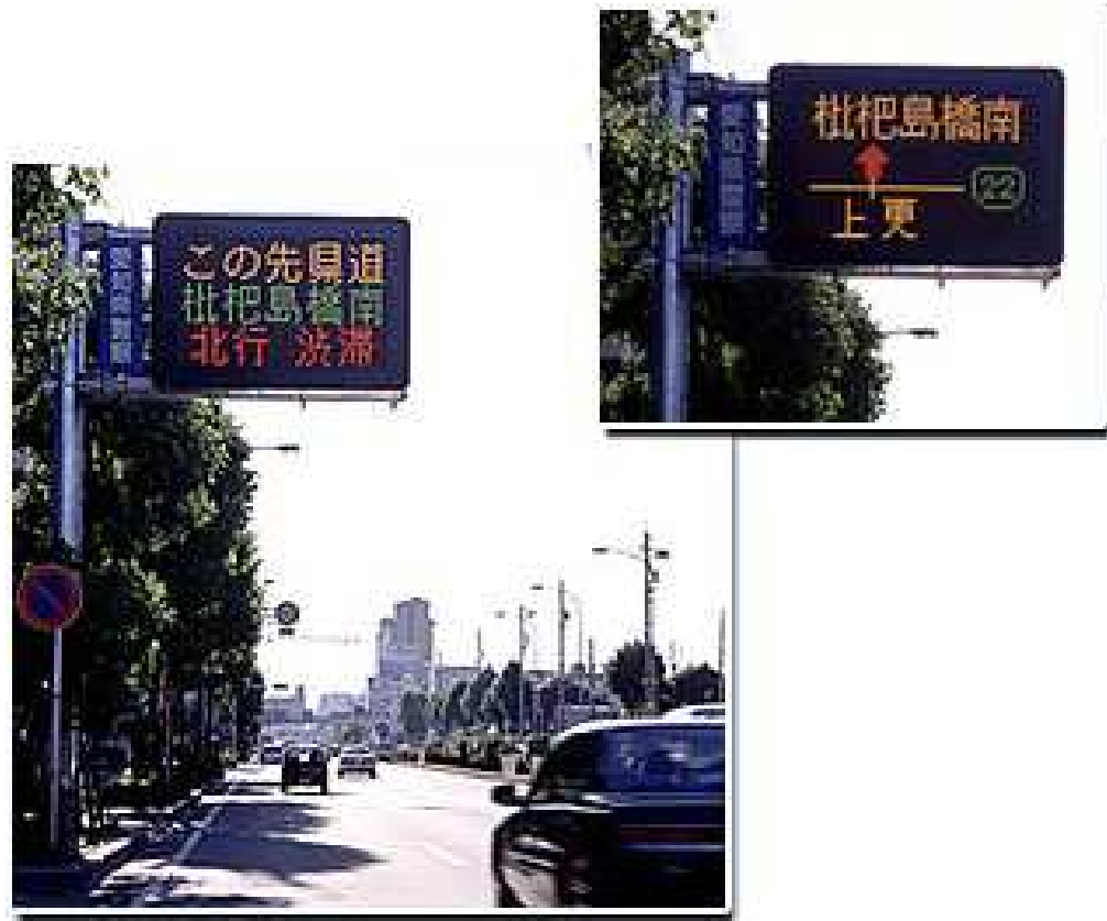
マルチパターン式交通情報板