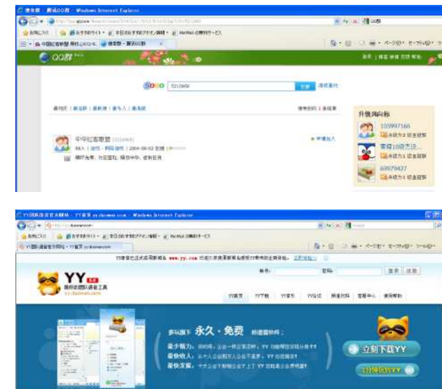
サイバー攻撃の謀議に使用されたチャット