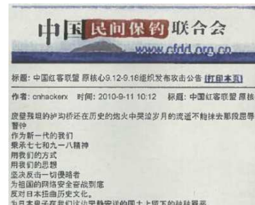
攻撃予告がなされたサイト