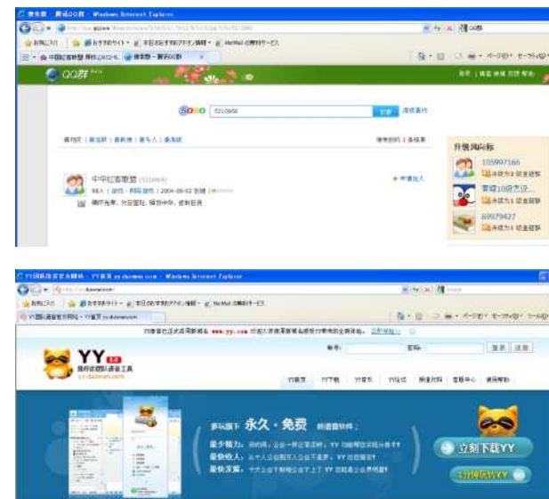
サイバー攻撃の謀議に使用されたチャット