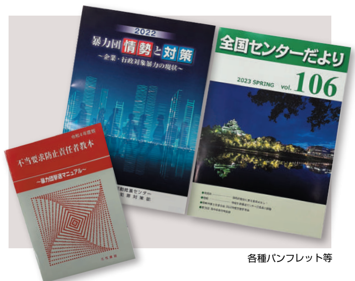
各種パンフレット等

都道府県センターや警察署では、「民暴相談のしおり」を配布し、その事業内容等を紹介しています。