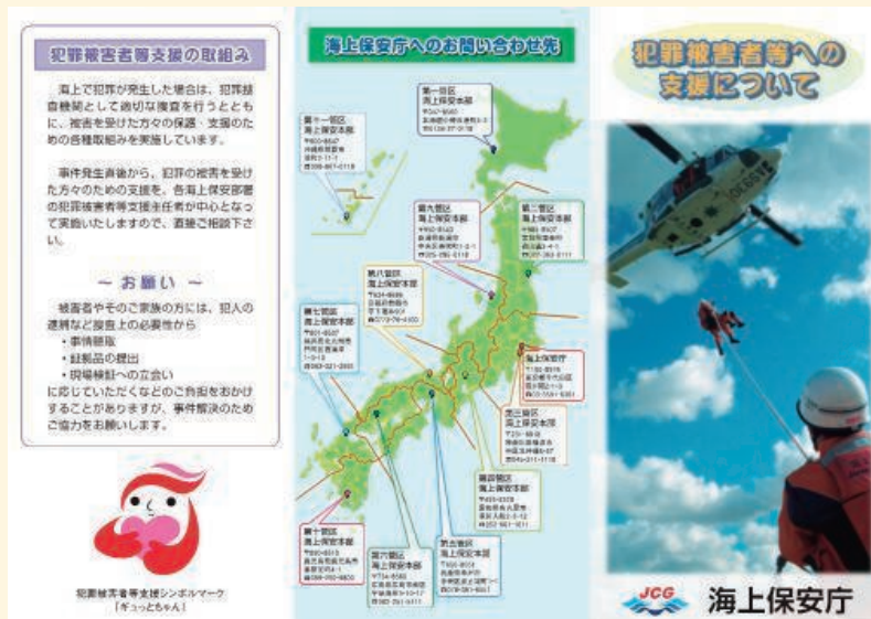
海上保安庁の犯罪被害者等支援に関するリーフレット

今後とも、犯罪被害者等が置かれた立場について理解を深めるとともに、その気持ちに寄り添いながら、犯罪被害者等に必要な支援を提供していく。