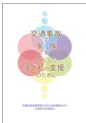
パンフレット 「交通事故で家族を亡くした子どもの支援のために」

平成26年度は、栃木県、岡山県の2県において、交通事故被害者等や子供の支援に係る関係機関の参加を得て、家族を亡くした子供の支援に関する専門家による講義、交通事故被害者遺族による講話の後、参加者による意見交換を実施した。