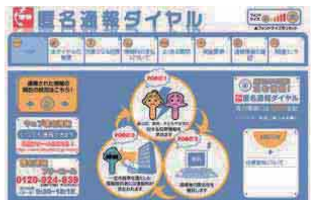
匿名通報ダイヤルホームページ

児童虐待の被害者については、街頭補導、少年相談など様々な活動の機会を通じ、その早期発見と児童相談所への確実な通告に努めている。また、各都道府県において国民に児童虐待事案の通告・通報を促すためのリーフレットを広く配布しているほか、平成22年2月から「匿名通報ダイヤル」の対象に児童虐待事案を追加し、運用している。さらに、都道府県知事・児童相談所長による児童の安全確認や一時保護、立入調査を円滑化するための援助を実施するとともに、要保護児童対策地域協議会（子どもを守る地域ネットワーク）などへ積極的に参加するなど、学校、児童相談所などの関係機関との情報交換や連携強化に努めている。