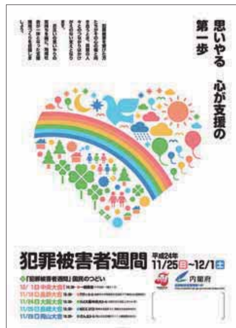
犯罪被害者週間ポスター

そのため、「国及び地方公共団体は、教育活動、広報活動等を通じて、犯罪被害者等が置かれている状況、犯罪被害者等の名誉又は生活の平穏への配慮の重要性等について国民の理解を求めよう必要な施策を講ずるもの（基本法第20条）」とされている。また、これを実現すべく、第2次基本計画において、「V 重点課題に係る具体的施策—第5 国民の理解の増進と配慮・協力の確保への取組」