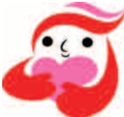
犯罪被害者等支援シンボルマーク