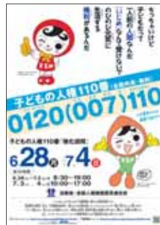
「子どもの人権110番ポスター」

このほか、全国の小中学校の児童・生徒に、「子どもの人権SOSミニレター」（便せん兼封筒）を配布したり、法務省のホームページ上に「インターネット人権相談受付窓口」を開設して、パソコンや携帯電話からインターネットでいつでも相談を受け付ける体制を整備するなど、更なる犯罪被害者等への相談体制の強化を図っている（P88(5)「犯罪被害者等からの各種人権相談への対応」参照）。