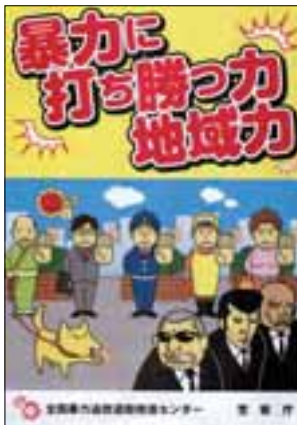
不当要求被害防止広報啓発ポスター

以上の施策を推進した結果、平成22年中は、462件の「企業及び行政対象暴力事犯」を検挙した。