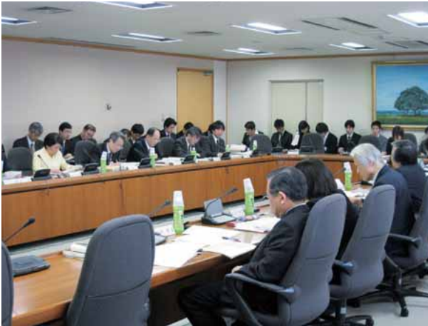
基本計画策定・推進専門委員等会議