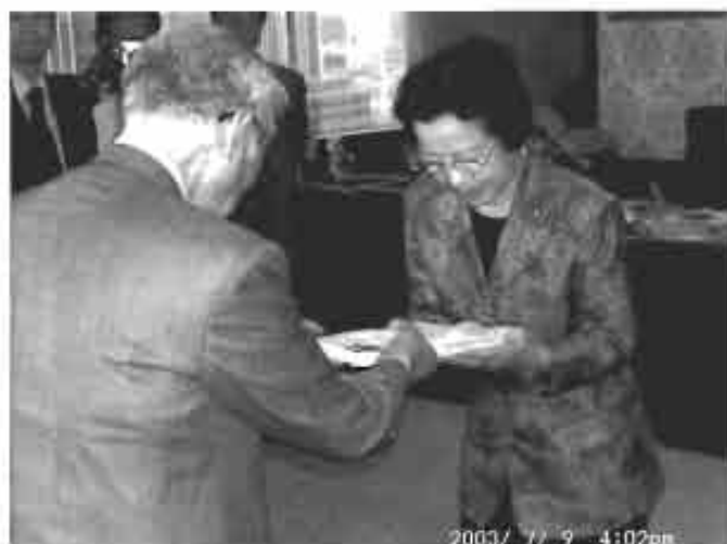
2003年7月9日 森山法務大臣に提出 390,063名分

11月23日・・・香川 11月29日・・・群馬 11月30日・山梨・徳島・沖縄 12月7日・・・長野 ----- 2004年 ----- 1月24日・・・愛媛 1月25日・高知・静岡・山口 2月1日・・・三重