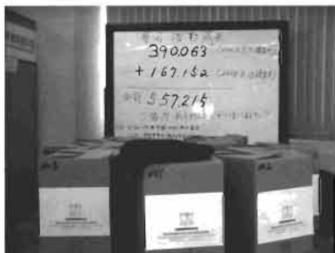
全国から寄せられた署名 ここのあるのは2回目提出分