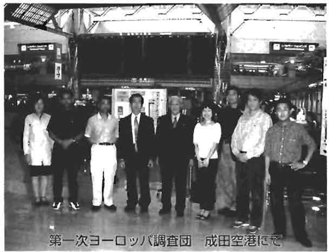
第一次ヨーロッパ調査団 成田空港にて