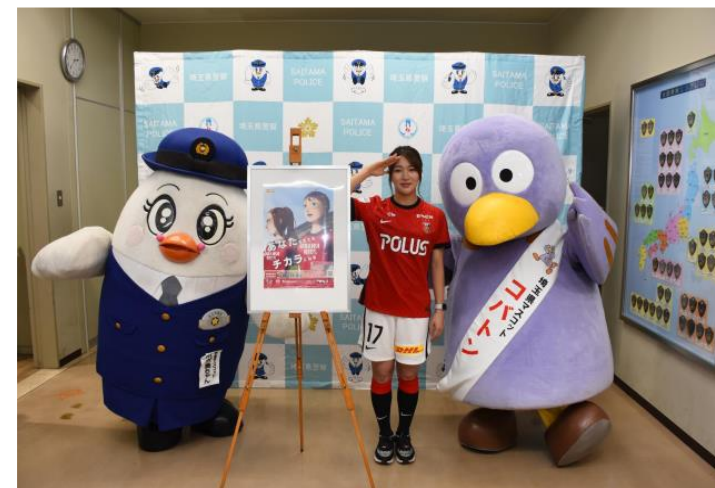
選手を招いたポスター完成披露写真撮影会 (埼玉県)