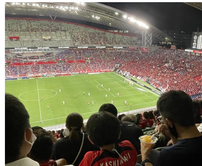
試合観戦への招待（埼玉県）