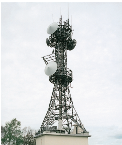
無線中継所（無線多重回線）

なお、警察の情報通信基盤は、自営の無線多重回線、衛星通信回線、電気通信事業者から借り上げた専用回線等により構成されており、これらを活用して、警察庁から警察本部はもちろん、第一線の警察署や交番に及ぶ全国的な各種ネットワークを構築し、警察業務を遂行する上で不可欠な情報伝達を行っている。