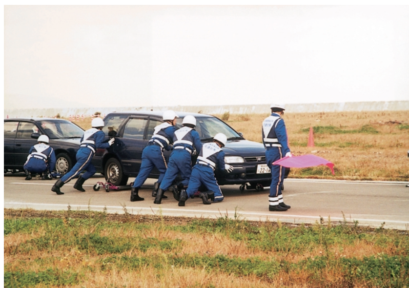
東北管区広域緊急援助隊総合訓練（ミニレッカーによる放置車両の移動）

管区警察局では、管轄区域内の各府県警察の警察職員に対し、職務倫理を保持させ、適正に職務を遂行する能力を修得させるため、中堅幹部職員の養成に重点を置いた教養を実施す