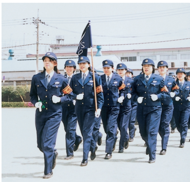
女性警察官（機動隊）

このため、民間企業と契約した「ベビーシッター制度」等、女性が働きやすい職場環境の整備も積極的に進められている。