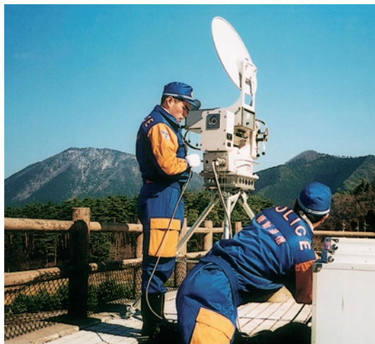
機動警察通信隊の活動