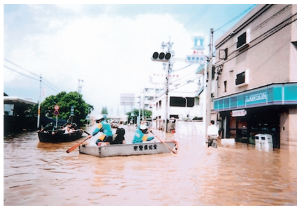
水難救助用ボート