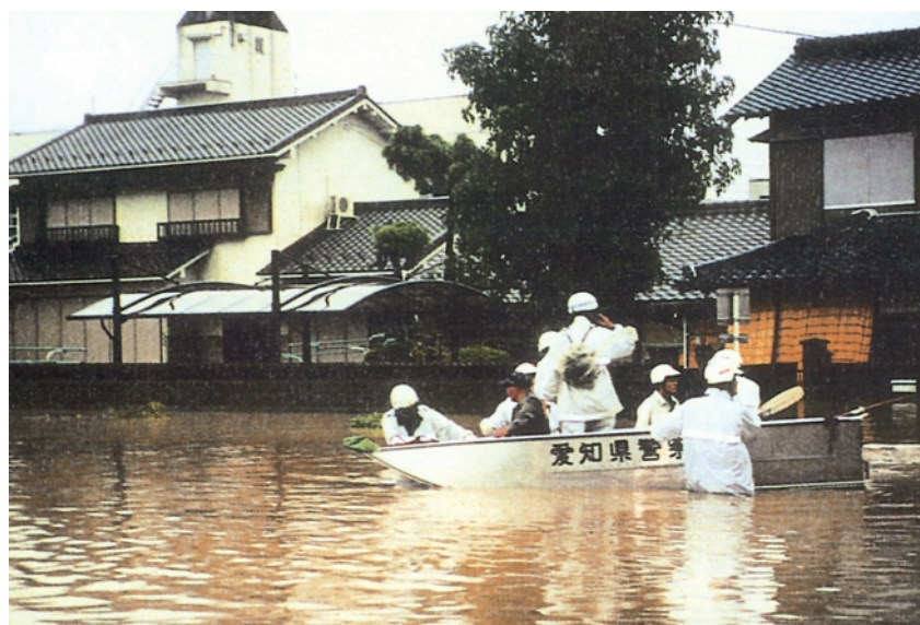
大雨災害における災害警備活動状況（9月，愛知）

警察では、平素から災害危険箇所の点検、パトロール等の活動を行うとともに、これらの災害の発生に際して、災害警備本部等を設置して所要の体制を確立し、関係機関との情報交換に努めるとともに、現場に広域緊急援助隊を始めとする警察部隊、ヘリコプター等を派遣して情報の収集、救出救助・行方不明者の搜索、住民の避難誘導及び交通規制等所要の災害警備活動を実施した。