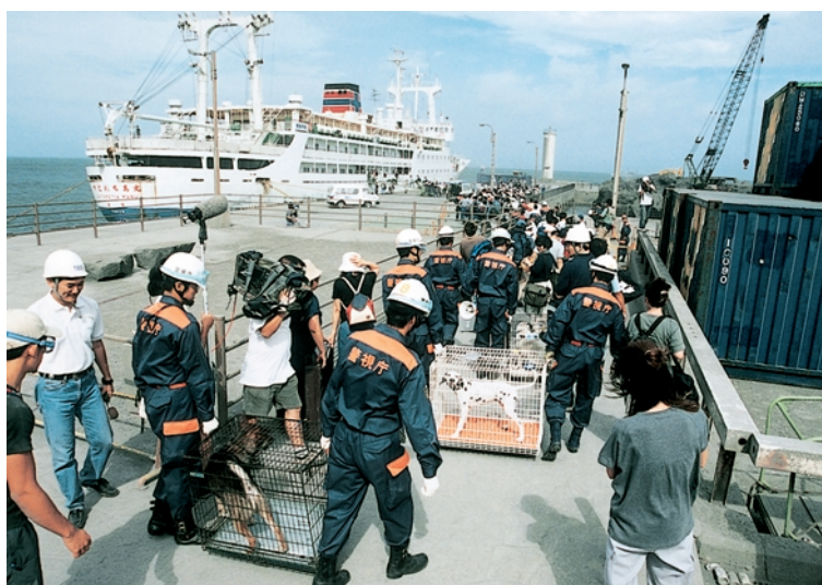
三宅島全島民の島外避難支援状況（9月，警視庁）

三宅島は、平成12年6月26日から火山性地震が増加し始めたことに伴い、緊急火山情報が出され、約1,300世帯約2,600人の住民に避難勧告が行われた。27日には三宅島の西海域で海