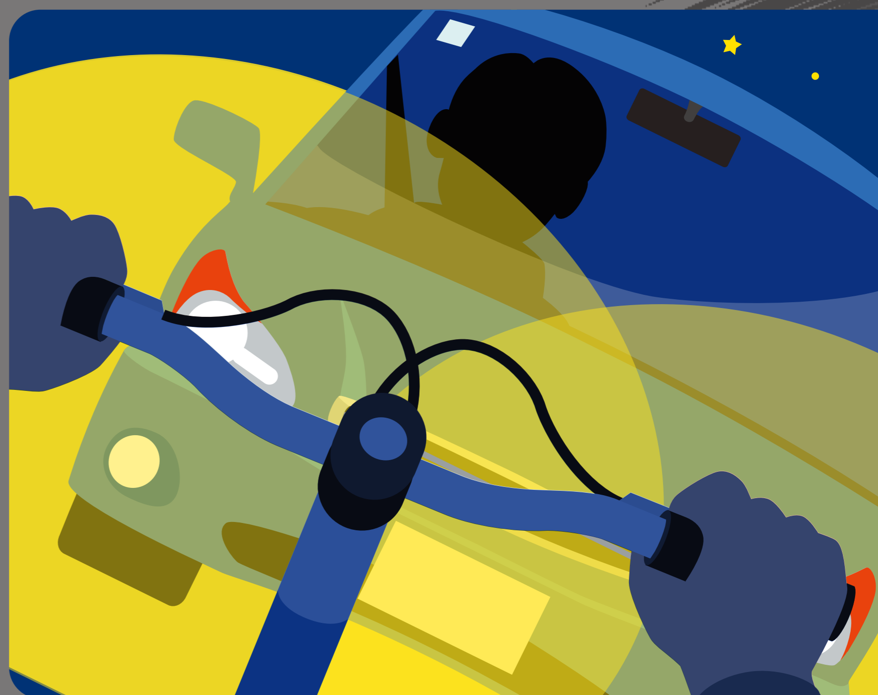
クルマは自転車に気づかない