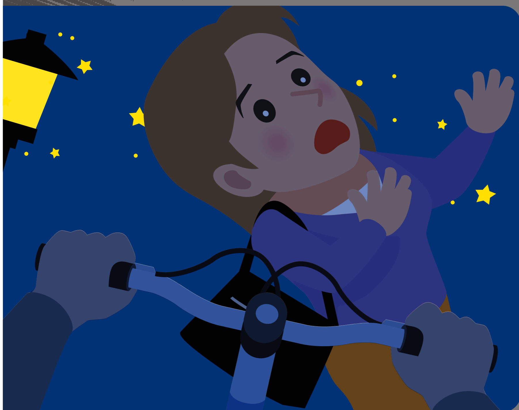
自転車は歩行者に気づけない