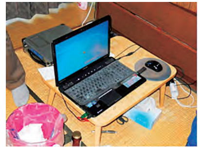
在留カード偽造拠点の摘発

今後とも不法滞在者の摘発を推進するとともに、不法滞在や偽装滞在を助長する集団密航、旅券・在留カード等の偽変造、地下銀行、偽装結婚等に係る犯罪に対する取締りを強化することとしています。