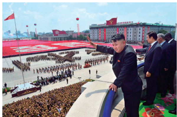
「祖国解放戦争勝利60周年」の閱兵式で観覧者に答礼する金正恩第一委員長