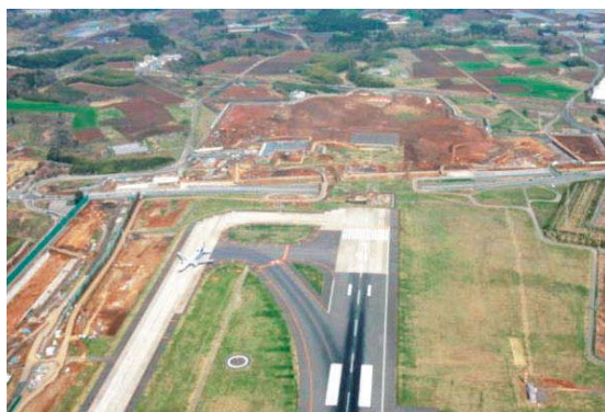
成田国際空港暫定平行滑走路北側延伸工事（4月）

協主流派等の過激派は、こうした動きに危機感を募らせ、二〇年一〇月五日開催の「全国総決起集会」では、耕作農地を所有する空港会社が示した賃貸借の解除期限（一〇月一三日）を間近に控えていたこともあり、二二年以降では最大となる約九一〇人を動員して、盛り上げを図りました。