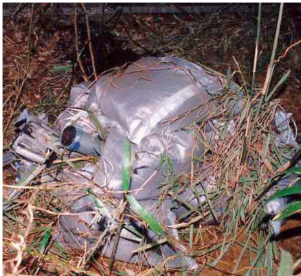
「成田国際空港に向けた飛翔弾発射事件」の発射装置（3月、千葉）

また、二〇年五月、組織的な犯罪の処罰及び犯罪収益の規制等に関する法律違反で、同派の活動家七人が逮捕されたことに対し、「戦後新左翼に対する最初の組対法適用攻撃」などとして、その「爆砕」を主張しました。この第一回公判では、全国から活動家を動員してデモ行進や公判傍聴に取り組みとともに、「組対法攻撃と闘う会」を結成し、活動家の逮捕に動揺する組織の引締めを図りました。