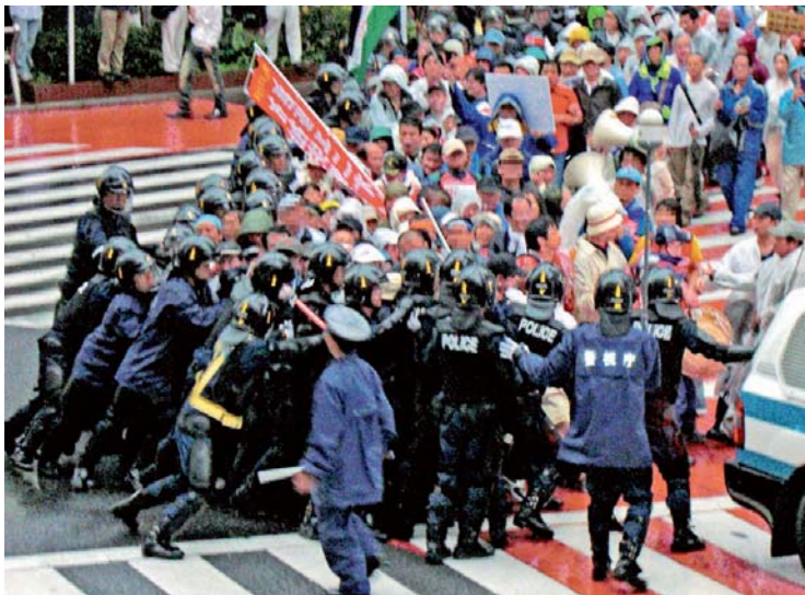
「全国労働者総決起集会」開催時のデモ(6月、東京)

また、北海道洞爺湖サミットへの反対行動を二〇年上半期の最大闘争と位置付け、五月二九日、法政大学構内に全国の学生活動家ら約五〇人を動員して集会、デモに取り組みましたが、警察は、活動家ら三三人を建造物侵入罪等で逮捕しました。さらに、党中央は「渋谷で大暴動を起こそう」などと訴え、六