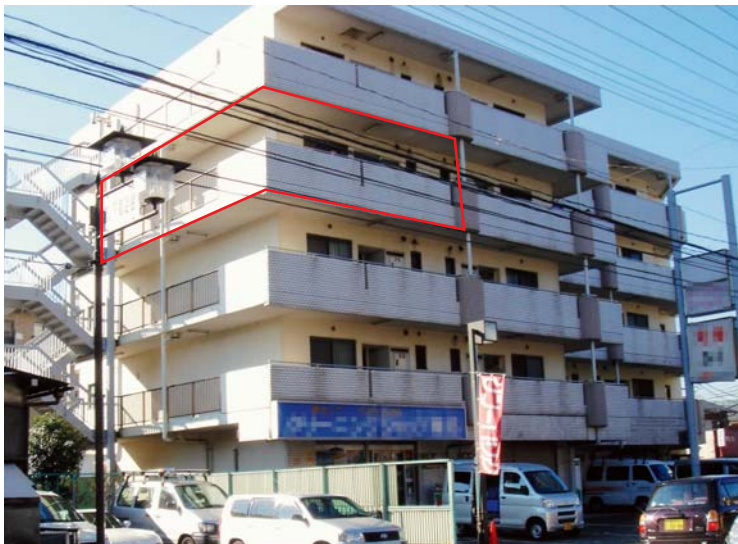
搜索したマンション（2月、神奈川県）

月八日、東京都、千葉県及び神奈川県内のマンション等に設定された革マル派の非公然アジト四箇所を一齐に摘発し、その一部アジトから押収した資料を分析した結果、同派が対立する組織・個人に対する調査活動を継続している実態の一部が明らかになりました。同派のこうした調査活動に要する経費には、活動家からのカンパ等労働運動や大衆運動への介入を通じて得られた資金が充てられており、同派は、財政基盤の確立も図っているものとみられます。