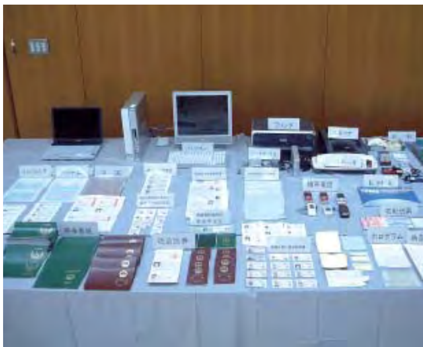
偽造工場からの押収品（10月、愛知）

国人登録証明書や旅券を、セットで二万四、〇〇〇円から四万二、〇〇〇円で販売していました。 本件では、中国やインドネシアなどの偽造旅券の表紙六一二枚や、偽造の素材として用意された全国の一八九自治体の公印の印影等を記録した電磁的記録媒体が押収されています。