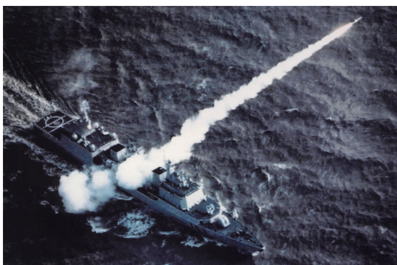
中露合同演習でミサイルを発射する中国海軍

る話を持ち掛けられ、訪中の際に中国公司関係者にテクニカル・オーダーの一覧を渡し、一九八〇年(五五年)ころから、訪中の都度、中国人の男から買い取ったテクニカル・オーダーを中国に売却していた事件です。この事件では、中国人の男の自宅から諜報通信受信用タイムテーブル、マイクロフィルム等が発見されています。