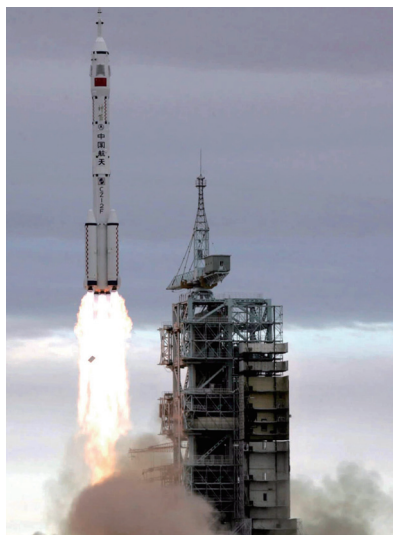
「神舟六号」の打ち上げ(時事)

中国は、二〇〇五年（平成一七年）一〇月、二度目となる有人宇宙船「神舟六号」の打ち上げに成功しました。中国の宇宙開発は、軍によって進められており、その情報は機密扱いで予算も公表されていません。「神舟」の命名者である江沢民前総書記は、二〇〇二年（一四年）三月、「神舟三号」の打ち上げ時に、「国防の現代化に重要な意義がある」と