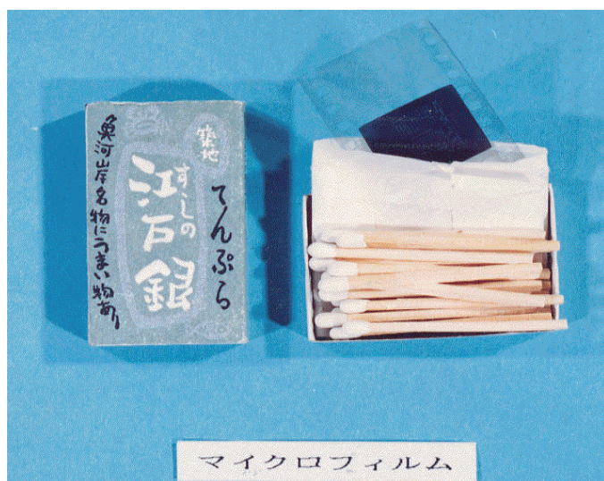
押収されたマイクロフィルム

在日旧ソ連大使館員の工作を受けた中国人の男と、中国公司関係者から工作を受けた親中団体幹部が、在日米軍横田基地従業員及び軍事評論家らと共に、約八年間にわたり、米空軍戦闘機や輸送機のテクニカル・オーダー(技術指示書)等の在日米空軍の資料を窃取し、多額の報酬を得て旧ソ連及び中国に売却していた諜報事件です。親中団体幹部は、中国人の男からテクニカル・オーダーを購入す