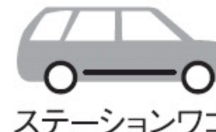
ステーションワゴン